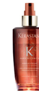
ESSENCE D'ÉCLAT Huile de brume hydratante