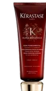
SOIN FONDAMENTAL Infusion de nutrition