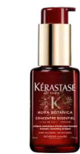
CONCENTRÉ ESSENTIEL Huile aromatique nourrissante