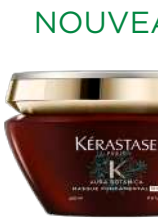
NOUVEAU MASQUE FONDAMENTAL RICHE Nutrition intense