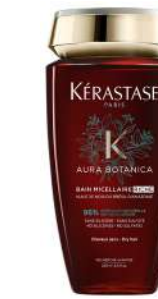
BAIN MICELLAIRE RICHE Shampooing aromatique riche