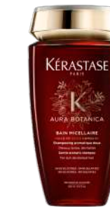
BAIN MICELLAIRE Shampooing aromatique doux