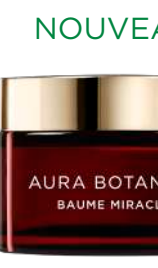
NOUVEAU BAUME MIRACLE Baume solide multi-bénéfices