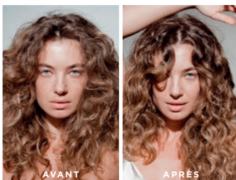
Cheveux non retouchés