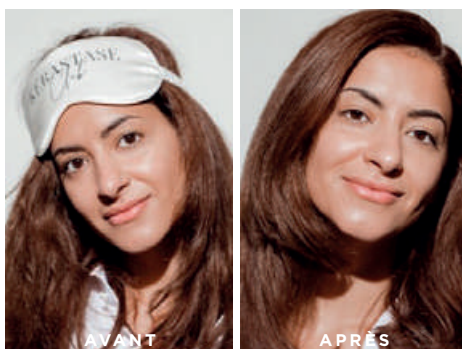
Cheveux non retouchés