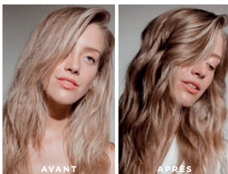
Cheveux non retouchés