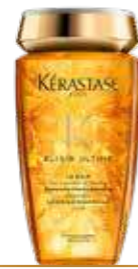
BAIN ELIXIR ULTIME TOUS TYPES DE CHEVEUX