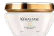
FONDANT TOUS TYPES DE CHEVEUX PARTICULIÈREMENT LES CHEVEUX FINS