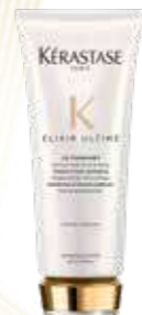
MASQUE ELIXIR ULTIME TOUS TYPES DE CHEVEUX PARTICULIÈREMENT LES CHEVEUX ÉPAIS