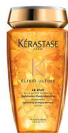
BAIN ELIXIR ULTIME VOOR ALLE HAARTYPES