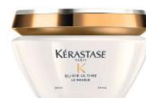
FONDANT ALLE HAARTYPES VOORAL FIJN HAAR